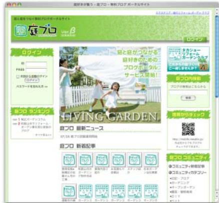
※ページは開発中のイメージです。

庭・ガーデン・エクステリアなどお庭好きの人々が、プロ・一般ユーザーを問わずに集まるコミュニティ“庭ブロ”が立ち上がります。“庭ブロ”は、ブログを媒体とする業種特化型ポータルサイトです。地域の生活者の方々と同じ趣味を共有する方々と積極的にコミュニケーションをとって頂くことが可能です。季節の移り変わりの共感や、季節の花々の情報共有、庭の暮らしの感動、地域コミュニティの形成、高齢者の社会参画など、庭での暮らしをより豊かにするためのコミュニティサイトを目指します。